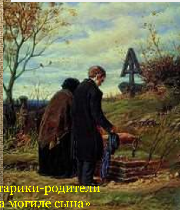
«Старики-родители на могиле сына»

В 1865 году В.Г.Перов создал одну из лучших своих картин: «Проводы покойника». В. В. Стасов писал: «Картина была маленькая по размерам, но великая по содержанию... Художество выступало тут во всем величии своей настоящей роли: оно рисовало жизнь, оно «объясняло» её, оно «произносило свой приговор» над её явлениями. ...Эти похороны ещё безотраднее и печальнее, чем у Некрасова в поэме «Мороз-Красный нос». Там гроб провозжали отец, мать, соседи и соседки, — у Перова никого. Перов дал полную покинутость и одиночество крестьянской семьи в её горе».