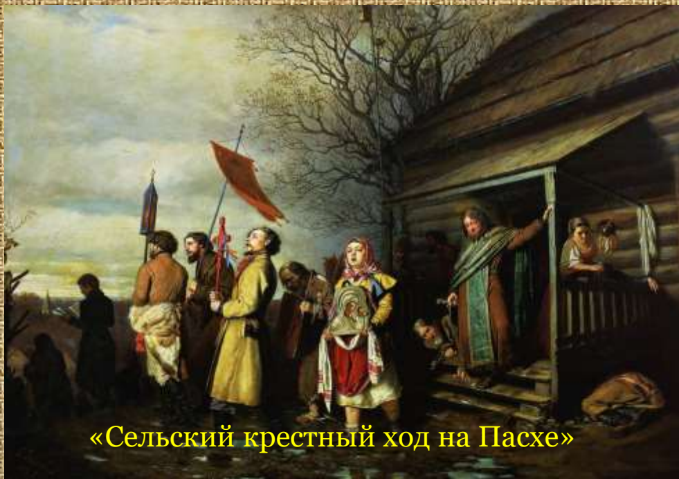
«Сельский крестный ход на Пасхе»

Вторая картина, написанная в том же, 1861 году – «Сельский крестный ход на Пасхе» - была отвергнута Академией художеств, но приобретена П.М.Третьяковым. Эта картина вызвала горячие споры. В.В.Стасов хвалил её за правду и искренность.