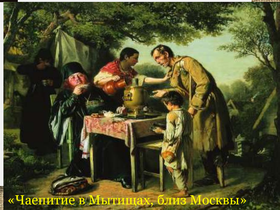
«Чаепитие в Мытищах, близ Москвы»

После окончания училища в 1862 году Перов написал картину «Чаепитие в Мытищах, близ Москвы», композиция которой была построена на противопоставлении тучного монаха-чревоугодника и хромого слепца, инвалида войны, с мальчиком-поводырем.