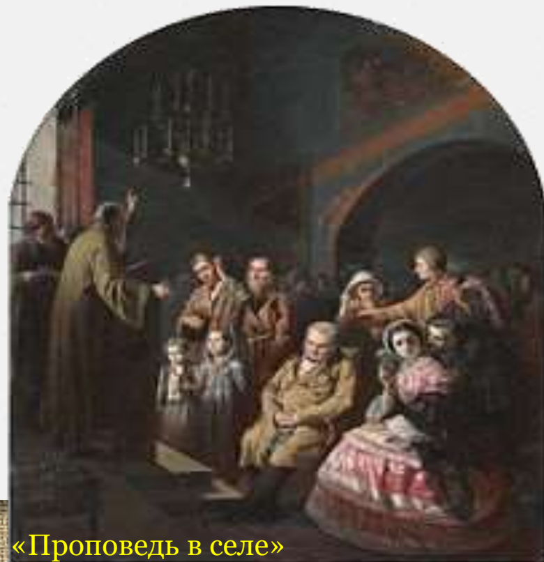
«Проповедь в селе»

Получив право участвовать в конкурсе на большую золотую медаль, Перов переехал в Санкт-Петербург. Здесь в 1861 году он написал картину «Проповедь в селе», за которую он получил большую золотую медаль и право поездки в качестве пансионера за границу.