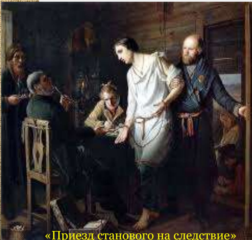
«Приезд станового на следствие»