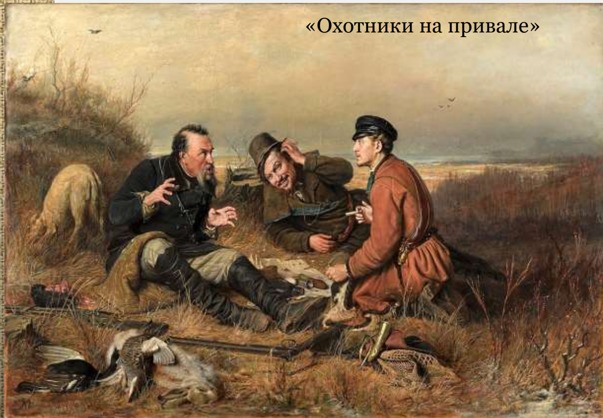
«Охотники на привале»

В 1871 году В. Г. Перов был назначен преподавателем Московского училища живописи, ваяния и зодчества.